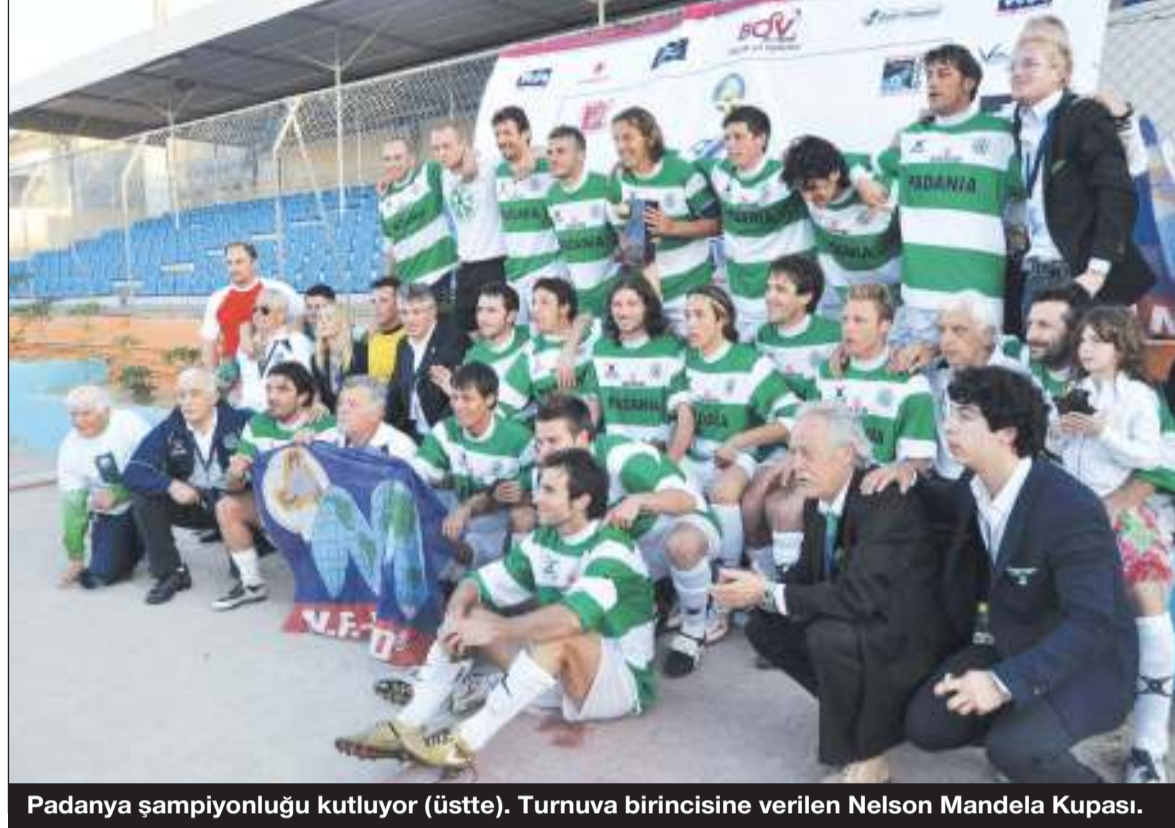
Padanya şampiyonluğu kutluyor (üstte). Turnuva birincisine verilen Nelson Mandela Kupası.