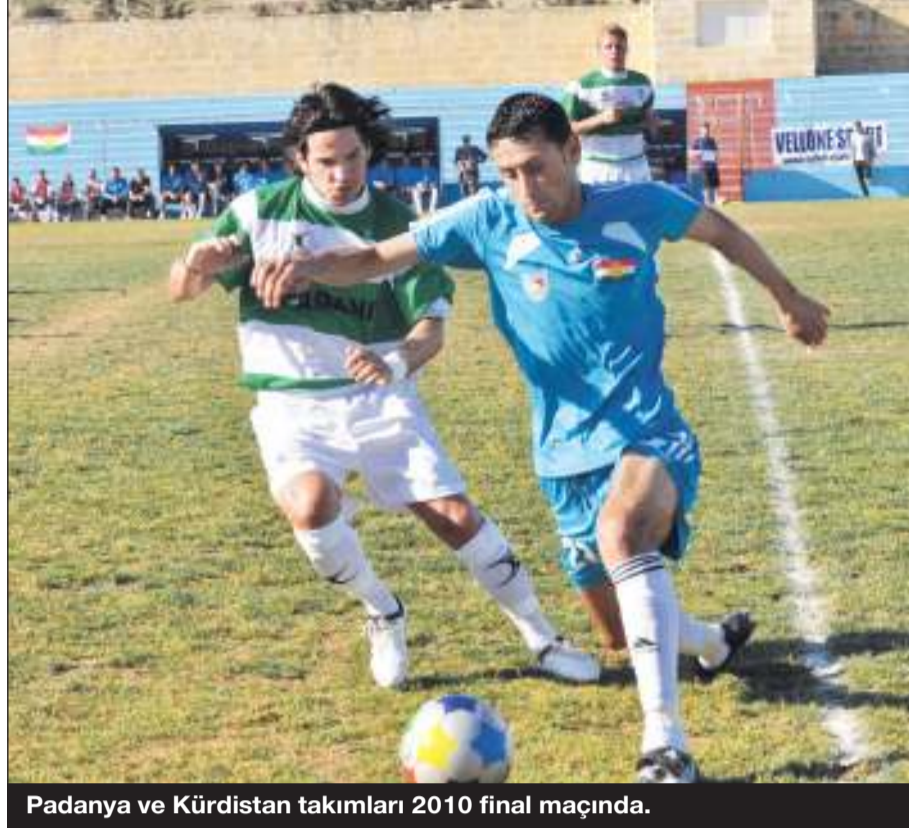
Padanya ve Kürdistan takımları 2010 final maçında.